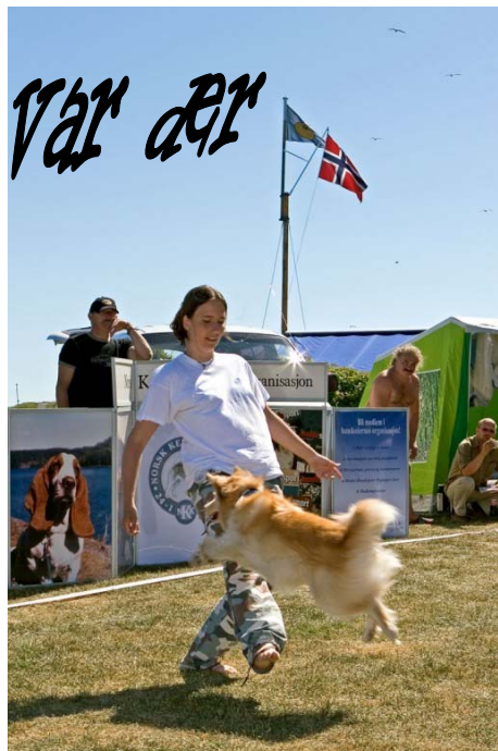
Norsk Kennel Klub avdeling Vestfold arrangerte "Hundens dag" i Stavern i juni