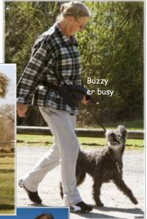
Buzzy er busy