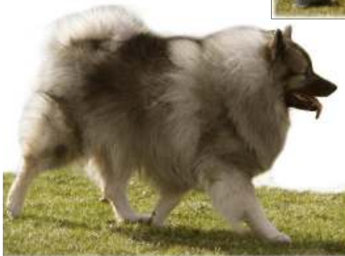
Trym vil være med!