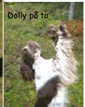
Dolly på to