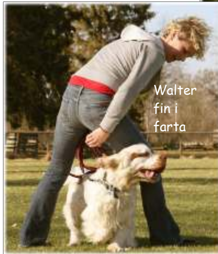
Walter fin i farta