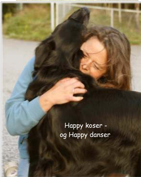
Happy koser - og Happy danser