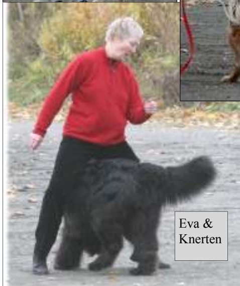
Eva & Knerten