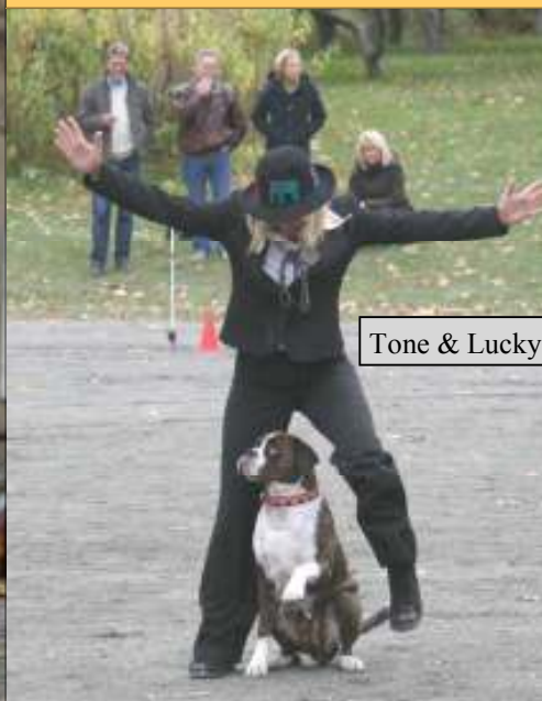
Tone & Lucky