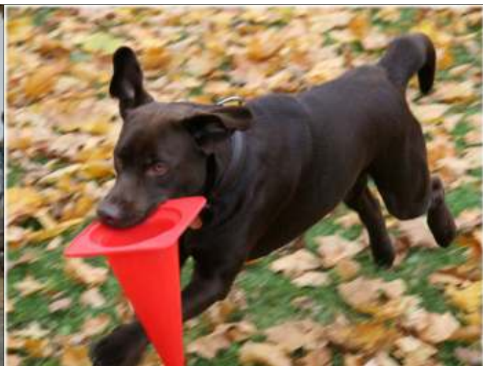
Lotus (eier Ingrid Stang) synes både freestyle og apportering av markør var veldig moro!