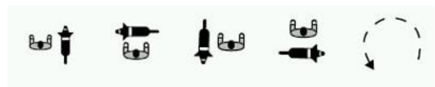
Posisjon 5 Posisjon 6 Posisjon 7 Posisjon 8

Posisjon 1-4 starter i fotposisjon på førerens venstre side, for så å forflytte seg med klokka rundt føreren.