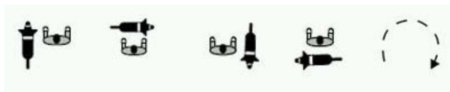
Posisjon 1 Posisjon 2 Posisjon 3 Posisjon 4

Posisjon 1-4 starter i fotposisjon på førerens venstre side, for så å forflytte seg med klokka rundt føreren.